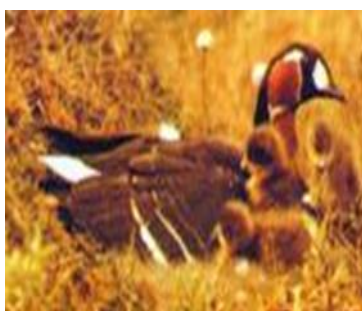
3. Краснозобая казарка