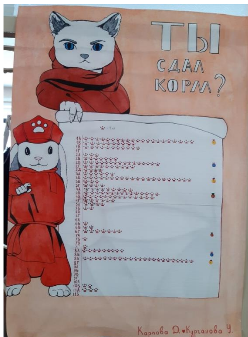
Плакат 10 класса

В нашей школе 10-й класс провёл эксперимент, основанный на воздействии советской символики на старшее и младшее поколение. Во время проведения благотворительной акции от «Планеты талантов» для приюта «Доброе сердце» 10-й и 11-й классы создали 2 плаката, целью которых было побудить людей пожертвовать корм, лекарства и другие средства, необходимые приюту животных «Доброе сердце».