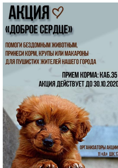
Плакат 11 класса

Основной идеей создания плаката учеников 11-го класса было воздействовать на чувства, растопить сердца людей жалостью к голодным и больным животным. Они выбрали картинку с милым пёсиком, и подпись с призывом о помощи братьям нашим меньшим.