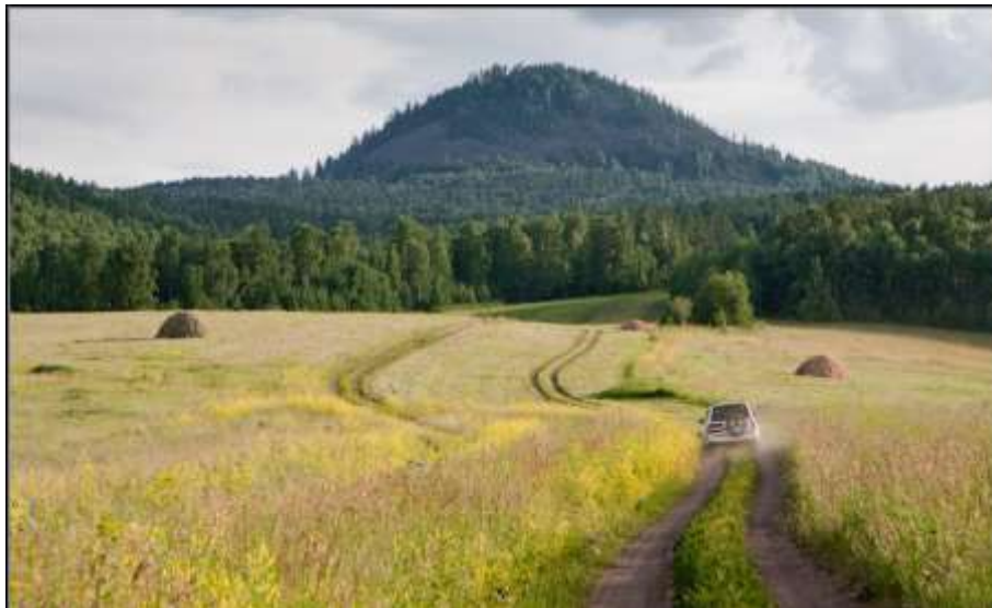
Подходы к Чёрной сопке от ст. Зыково