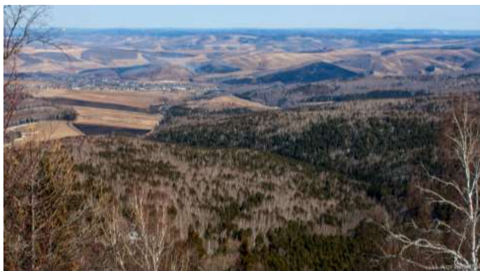
Пейзажи с высоты птичьего полета